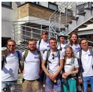
5- Edition 2022

La formation est réduite à 1,5 jours. Y sont abordés la communication non-violente (par un formateur issu du réseau de formateurs en CNV - communication non violente), la communication entre les stewards, la gestion logistique et les postures à adopter face aux groupes mais aussi face aux risques potentiels (bagarre, agression, coma éthylique, ...). Enfin Univers Santé sensibilise les jeunes aux aspects physiologiques de la consommation d'alcool et la Maison du développement durable à la pollution des eaux par les mégots et autres capsules de bière.